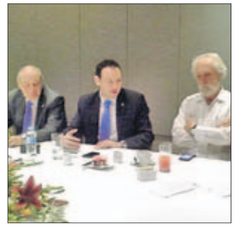
Martínez, en el centro, en México.

—Cuando entramos nosotros en la UE, en 1986, otras regiones perdieron esos fondos que se llevó Asturias. Estos procesos los tenemos que asumir como propios de una construcción supranacional que tiene muchos costes.