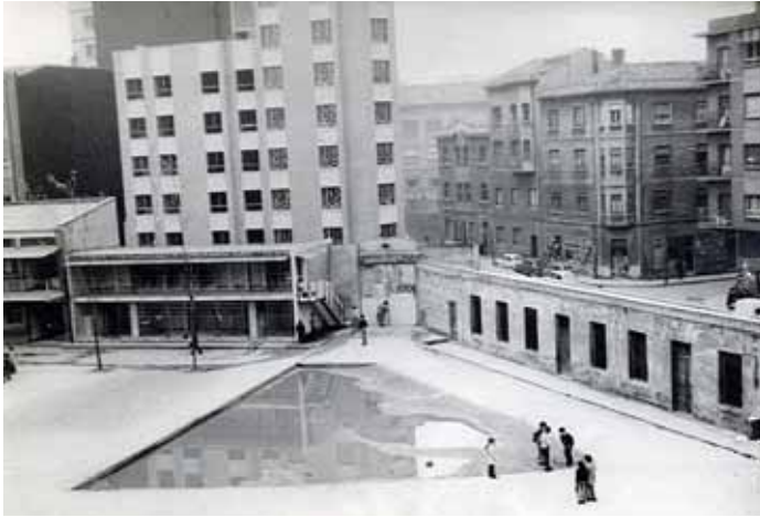
Antiguos baños y patio de arena (1974)