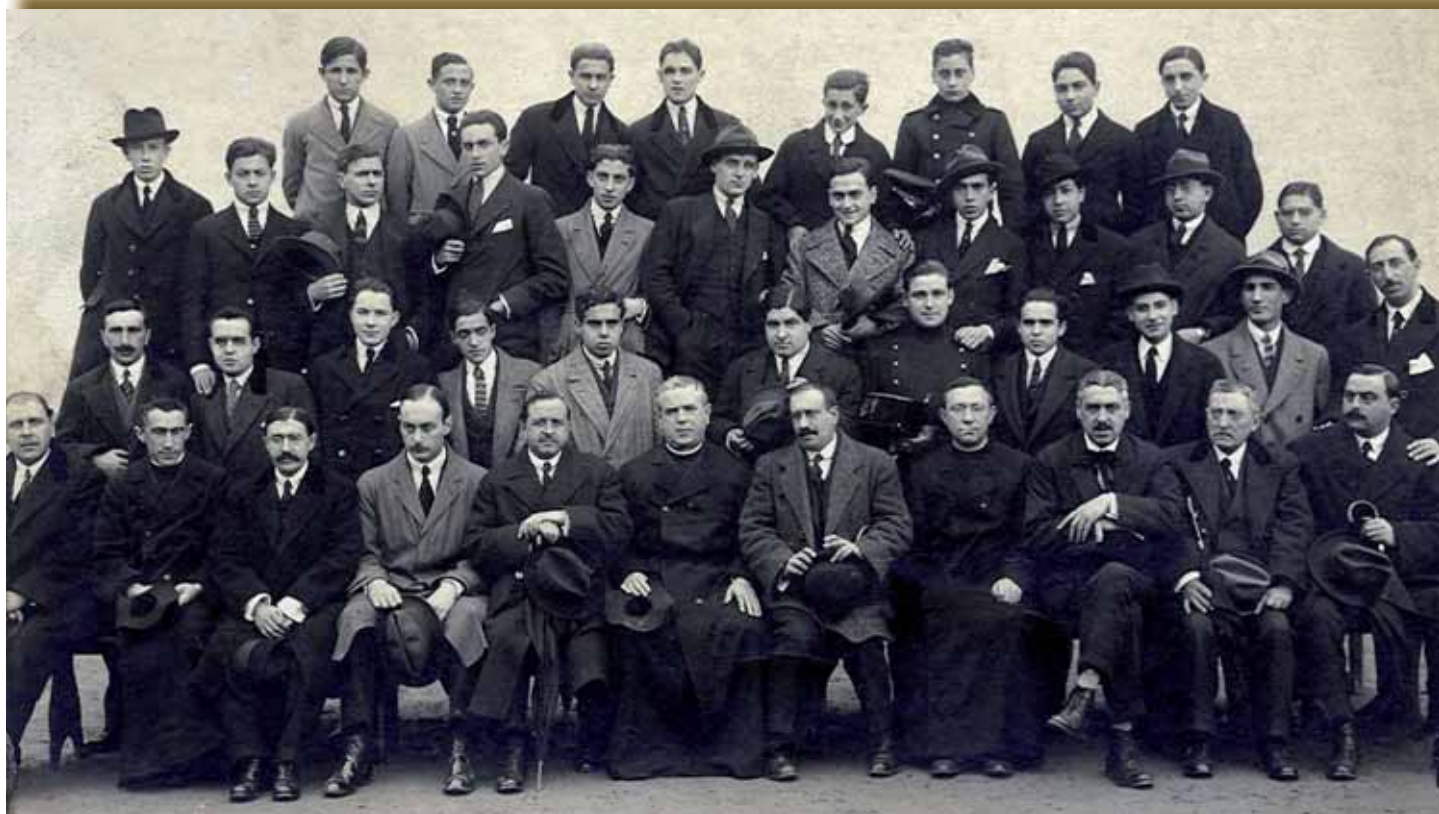
Día del Antiguo Alumno, año 1918