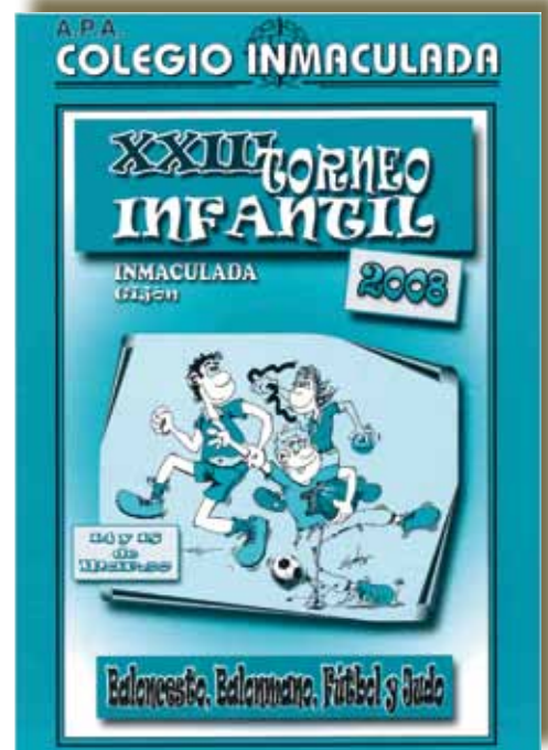
XXIII Torneo Infantil, 2008